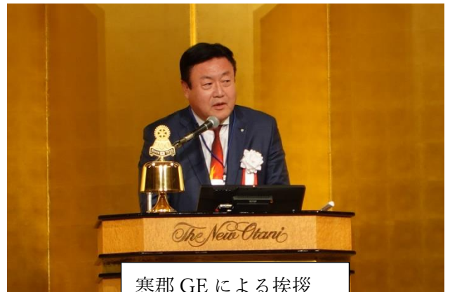
寒郡 GE による挨拶