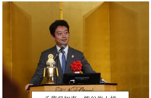
千葉県知事 熊谷俊人様