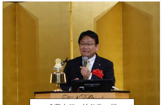
千葉市長 神谷俊一様