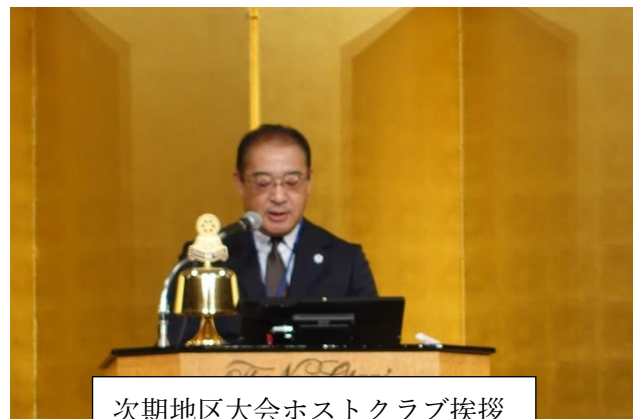
次期地区大会ホストクラブ挨拶