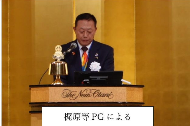
梶原等 PG による 選挙管理委員会報告