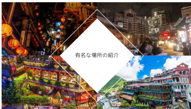
有名な場所の紹介

ここは蒋介石を記念に建てられた場所です。とても有名な場所です。見どころは衛兵で選ばれた人しかありません。