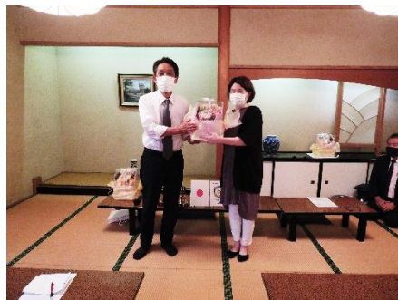
事務局もお花をいただきました。ありがとうございました。