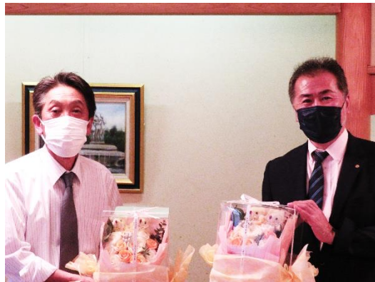
1年間お疲れ様でした。