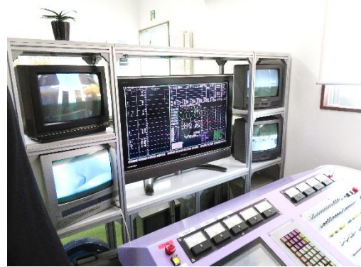
コンピューターで管理