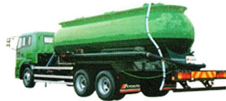
粉粒体運搬車 (通称 バラセメント車)

粉末状セメント販売が占める割合が大きい 販売先は生コン工場、コンクリート 2 次製品工場、杭工事業者、商社等